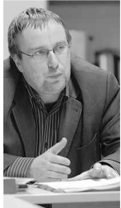
Oliver Krischer fordert angesichts des historisch tiefen Leitzinsniveaus deutlich geringere Überziehungszinsen – notfalls vom Gesetzgeber verordnet.

Wir sind dankbar, dass unsere Kunden diese Tatsache bei unserer jährlich durchgeführten Kundenzufriedenheitsstudie immer wieder honorieren.